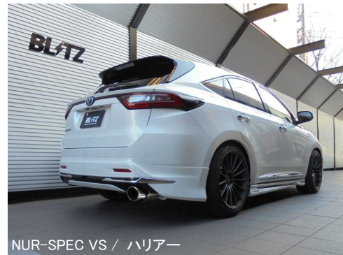
NÜR-SPEC VS / ハリアー