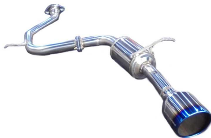
NÜR-SPEC VSR / ハリアー