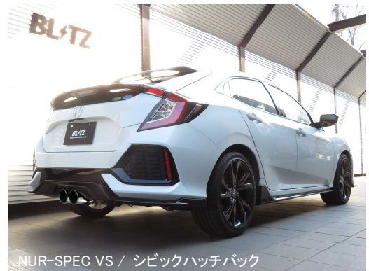
NUR-SPEC VS / シビックハッチバック