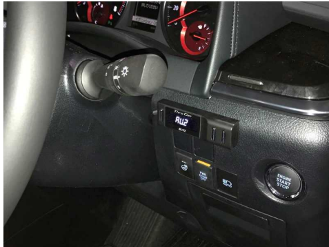
アルファード/ヴェルファイア 装着例