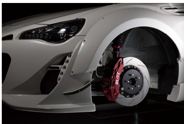
86 ZN6 Front