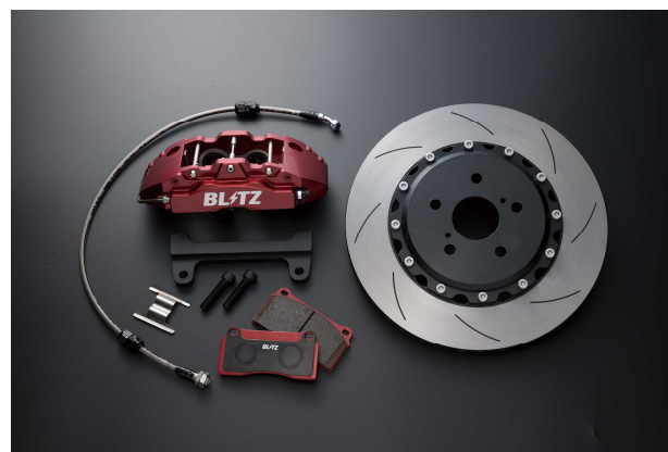
ALPHARD/VELLFIRE ##H30W Front Kit