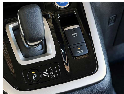
NISSAN セレナ e-Power