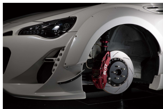
86 ZN6 Front