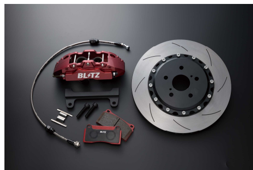
ALPHARD/VELLFIRE ##H30W Front Kit