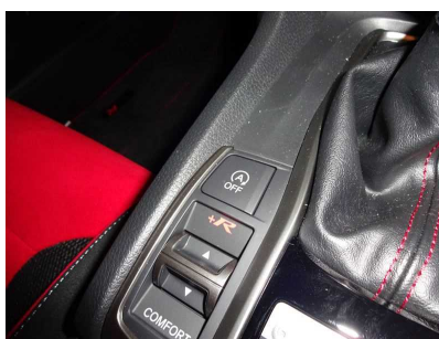
HONDA シビックタイプ R アイドリングストップ