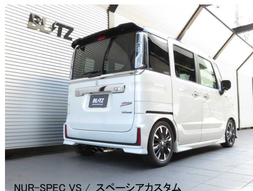
NUR-SPEC VS / スペーシアカスタム