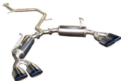
NUR-SPEC VSR /PRIUS PHV(GR SPORT)