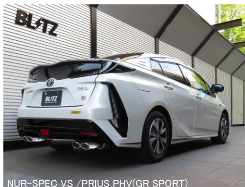
NUR-SPEC VS /PRIUS PHV(GR SPORT)