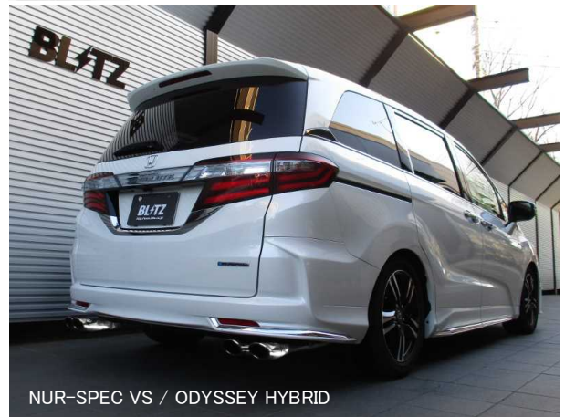
NUR-SPEC VS / ODYSSEY HYBRID