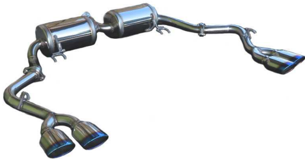
NUR-SPEC VSR / ODYSSEY HYBRID