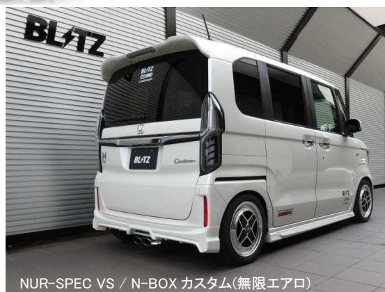
NUR-SPEC VS / N-BOX カスタム(無限エアロ)