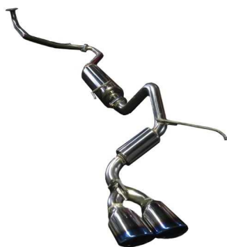
NUR-SPEC VSR / N-BOX カスタム(無限エアロ)