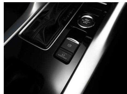
MITSUBISHI エクリプスクロス