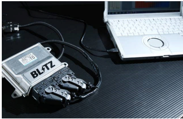
BLITZ TUNING ECU