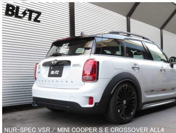
NÜR-SPEC VSR / MINI COOPER S E CROSSOVER ALL4