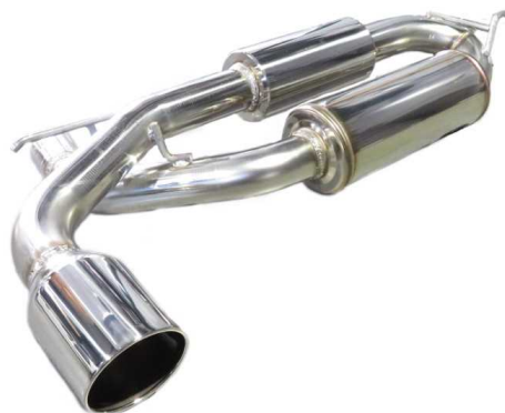
NÜR-SPEC VS / MINI COOPER S E CROSSOVER ALL4