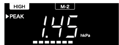
チャンネル【HIGH M-2】 ピークホールド表示画面

【お問い合わせ】 BLITZ Support Center Phone:0422-60-2277 Fax:0422-60-0066