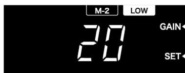
チャンネル【LOW M-2】 GAIN 値設定画面