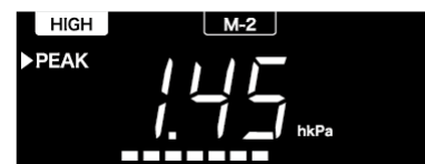
チャンネル【HIGH M-2】 ピークホールド表示画面

【お問い合わせ】 BLITZ Support Center Phone:0422-60-2277 Fax:0422-60-0066