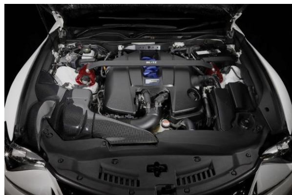
製品装着画像(全景)