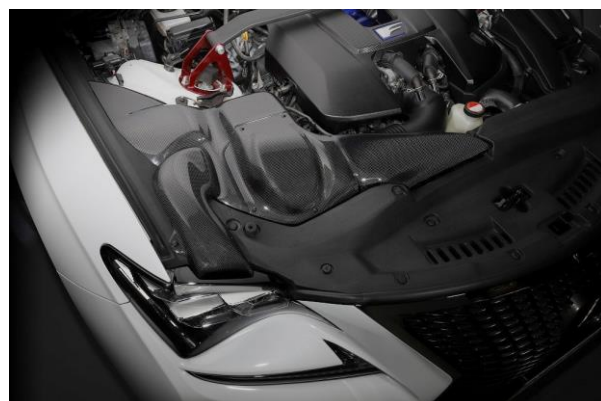
製品装着画像(拡大)

【お問い合わせ】 BLITZ Support Center Phone:0422-60-2277 Fax:0422-60-0066