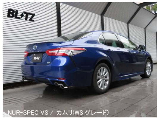
NÜR-SPEC VS / カムリ(WS グレード)