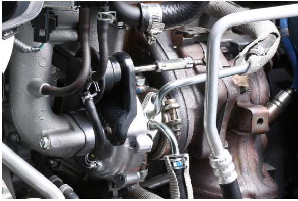
2940ALT-100R タービン 車両装着状態