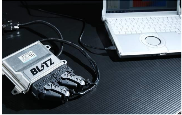
BLITZ TUNING ECU