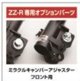
ミラクルキャンバーアジャスター フロント用