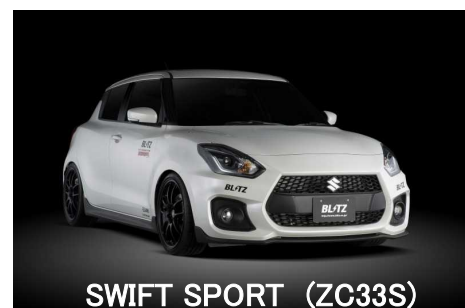
SWIFT SPORT (ZC33S)