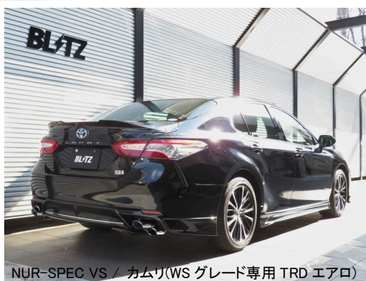
NÜR-SPEC VS / カムリ(WSグレード専用 TRD エアロ)