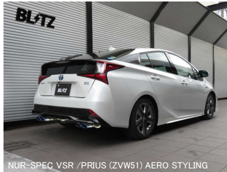
NÜR-SPEC VSR / PRIUS (ZVW51) AERO STYLING