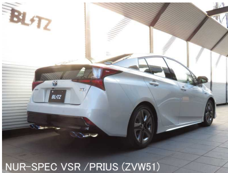
NÜR-SPEC VSR / PRIUS (ZVW51)