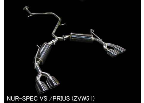
NÜR-SPEC VS / PRIUS (ZVW51)