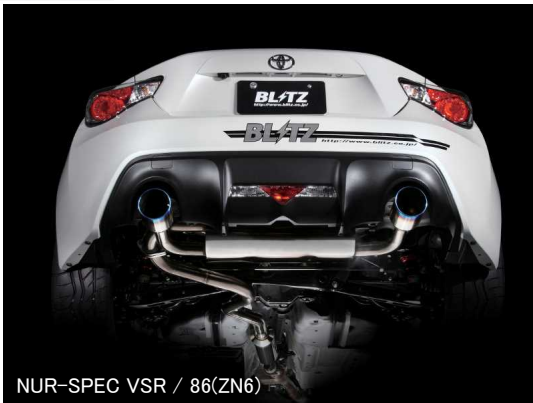
NÜR-SPEC VSR / 86(ZN6)