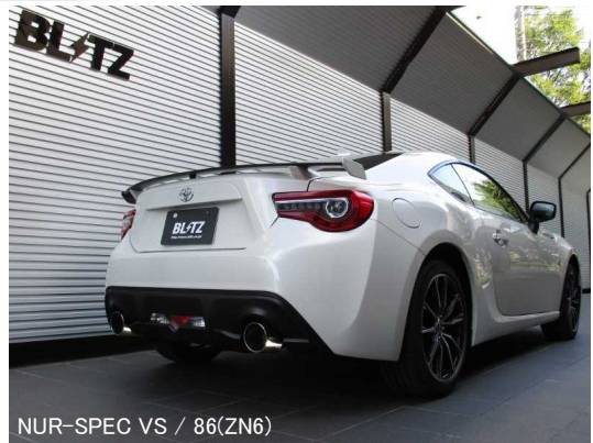
NÜR-SPEC VS / 86(ZN6)