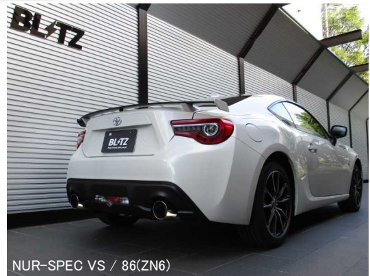
NÜR-SPEC VS / 86(ZN6)