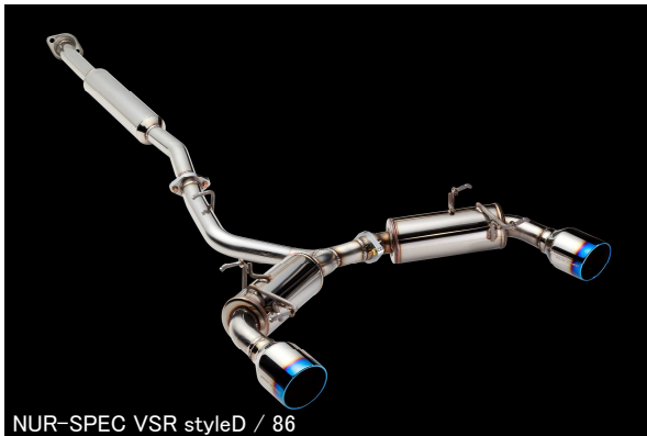
NÜR-SPEC VSR styleD / 86