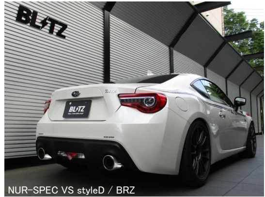
NÜR-SPEC VS styleD / BRZ