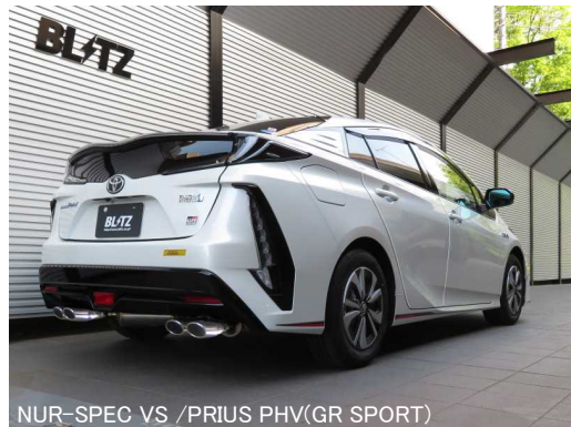
NUR-SPEC VS /PRIUS PHV(GR SPORT)