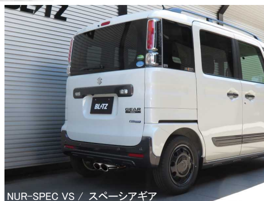
NUR-SPEC VS / スペーシアギア