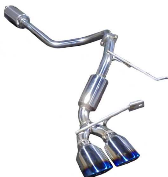
NUR-SPEC VSR / スペーシアギア