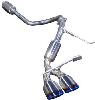
NUR-SPEC VSR / スペースアギア