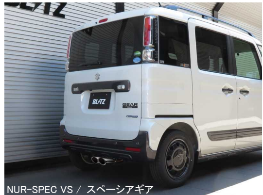
NUR-SPEC VS / スペースアギア