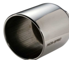
NUR-SPEC CE VS テール