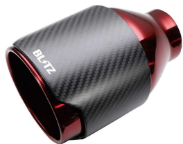
NUR-SPEC CE CARBONRED テール