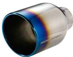
NUR-SPEC CE VSR テール