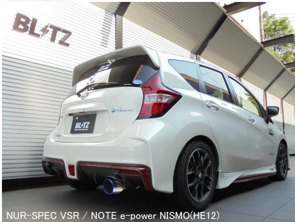
NÜR-SPEC VSR / NOTE e-power NISMO(HE12)