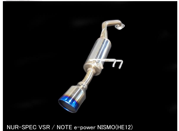
NÜR-SPEC VSR / NOTE e-power NISMO(HE12)