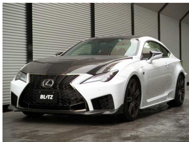
LEXUS RC F