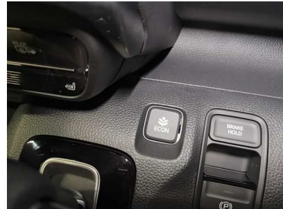
HONDA N-WGN アイドリングストップ