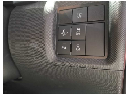
TOYOTA ライズ アイドリングストップ