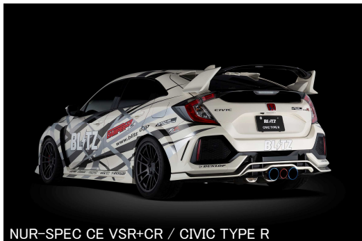
NUR-SPEC CE VSR+CR / CIVIC TYPE R