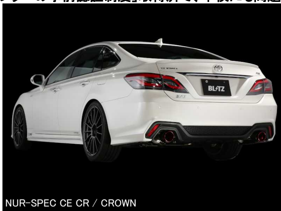
NUR-SPEC CE CR / CROWN