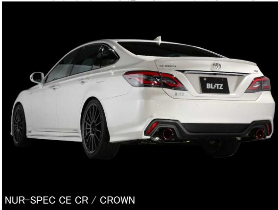
NUR-SPEC CE CR / CROWN