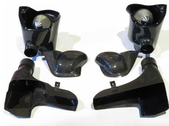
27025_CARBON INTAKE SYSTEM R35 GT-R