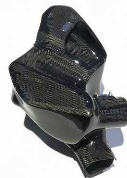
27026_CARBON INTAKE SYSTEM DB42 SUPRA