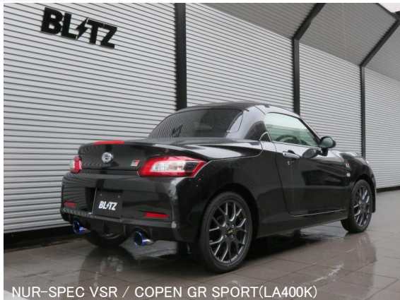
NÜR-SPEC VSR / COPEN GR SPORT(LA400K)