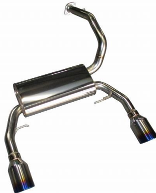
NÜR-SPEC VSR / COPEN GR SPORT(LA400K)