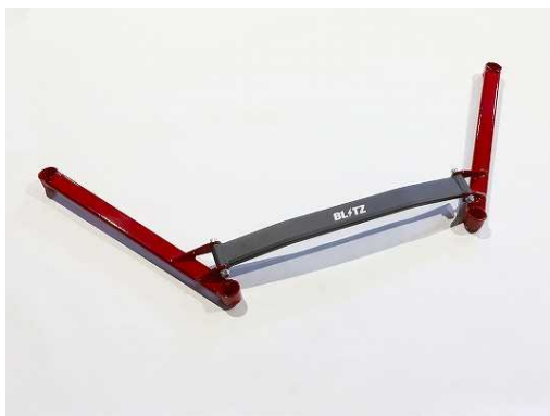
品番:96169 DB22 Front