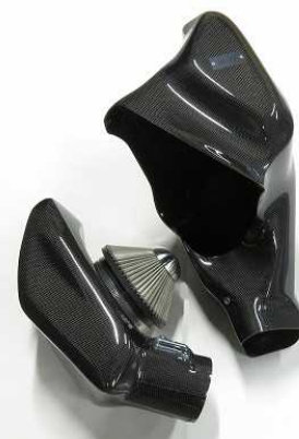
27027_CARBON INTAKE SYSTEM DB82 SUPRA