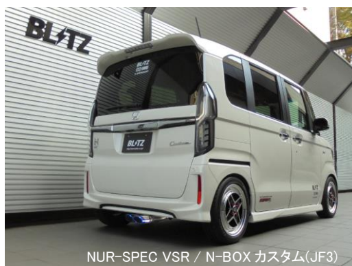
NÜR-SPEC VSR / N-BOX カスタム(JF3)