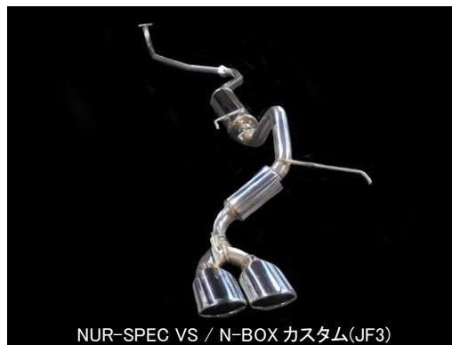
NÜR-SPEC VS / N-BOX カスタム(JF3)