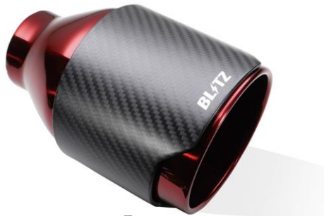
NUR-SPEC CE CR テール

※1: 装着時、交換部分と路面とのクリアランスが一番小さい部分を記載しています。 ノーマル車高時のデータを記載していますが、車両個体差のため記載データと異なる場合があります。予めご了承下さい。