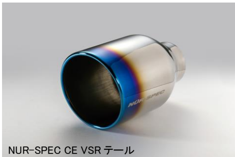
NUR-SPEC CE VSR テール