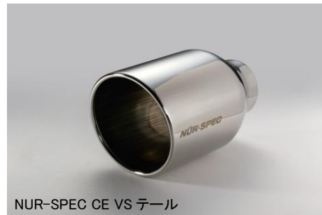
NUR-SPEC CE VS テール