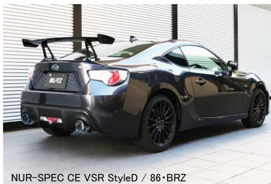
NUR-SPEC CE VSR StyleD / 86・BRZ