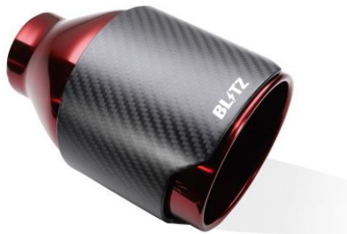
NUR-SPEC CE CR テール

※1: 装着時、交換部分と路面とのクリアランスが一番小さい部分を記載しています。 ノーマル車高時のデータを記載していますが、車両個体差のため記載データと異なる場合があります。予めご了承下さい。