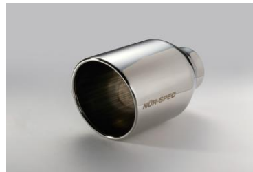
NUR-SPEC CE VS テール