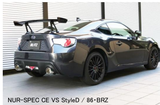
NUR-SPEC CE VS StyleD / 86・BRZ