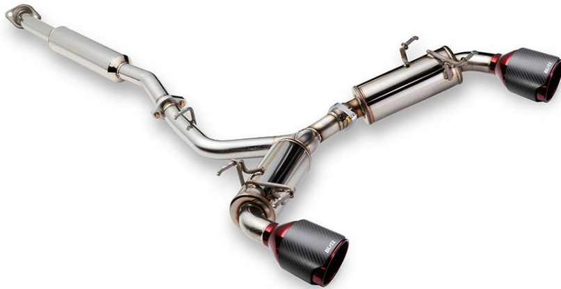
NUR-SPEC CE CR StyleD / 86・BRZ