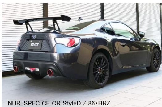
NUR-SPEC CE CR StyleD / 86・BRZ