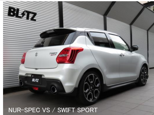
NUR-SPEC VS / SWIFT SPORT