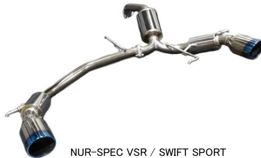
NUR-SPEC VSR / SWIFT SPORT