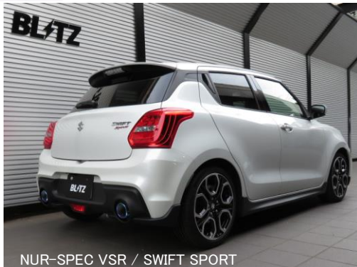
NUR-SPEC VSR / SWIFT SPORT