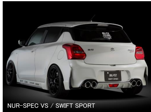
NUR-SPEC VS / SWIFT SPORT