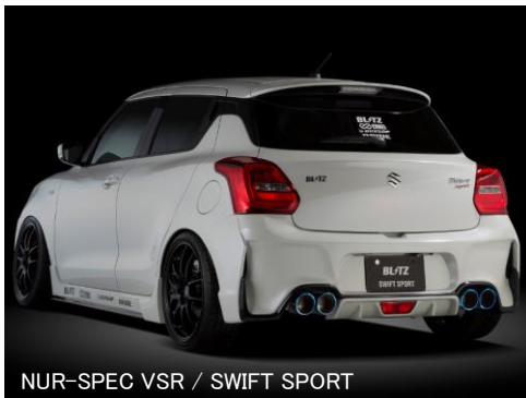
NUR-SPEC VSR / SWIFT SPORT