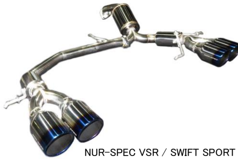
NUR-SPEC VSR / SWIFT SPORT