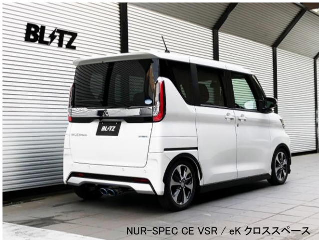
NUR-SPEC CE VSR / eK クロススペース