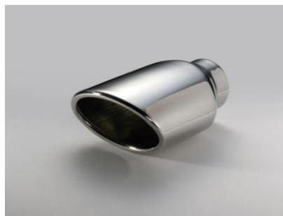
NUR-SPEC CE VS テール