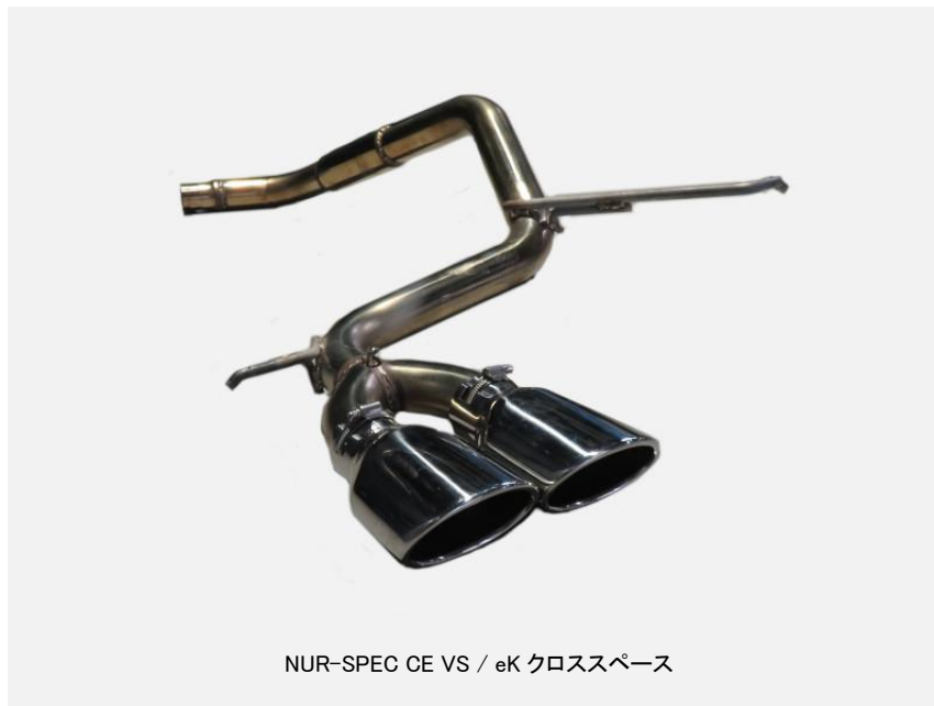
NUR-SPEC CE VS / eK クロススペース