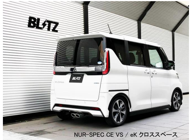
NUR-SPEC CE VS / eK クロススペース