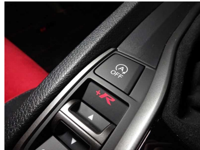
ホンダ シビックタイプ R アイドリングストップ