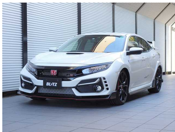
HONDA CIVIC TYPE R FK8