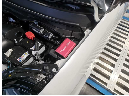
HONDA N-ONE 装着例