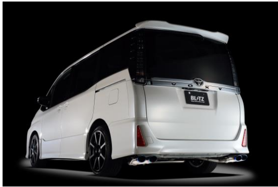
NUR-SPEC VSR QUAD / ヴォクシー