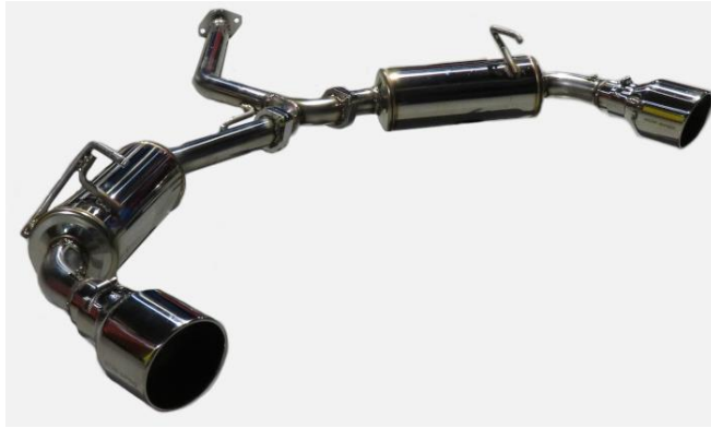
CUSTOM EDITION VS / ハリアーハイブリッド