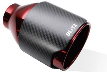
NUR-SPEC CE CRテール

※1：装着時、交換部分と路面とのクリアランスが一番小さい部分を記載しています。 ノーマル車高時のデータを記載していますが、車両個体差のため記載データと異なる場合があります。 予めご了承ください。