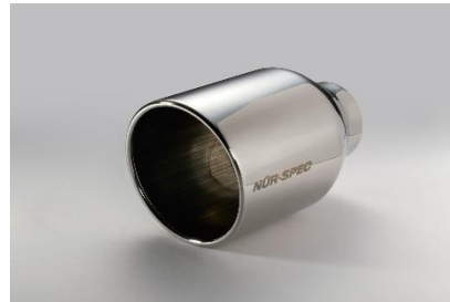
NUR-SPEC CE VSテール